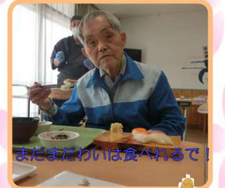
まだまだわいは食べれるで！