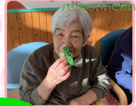
バジルのいいにおい♪