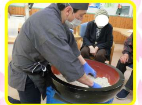
新年そば打ち & 握りずし