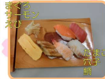
まぐろ サーモン えび