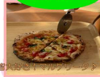
皆大好き！マルゲリータ♪