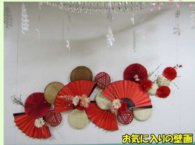
お気に入りの壁画