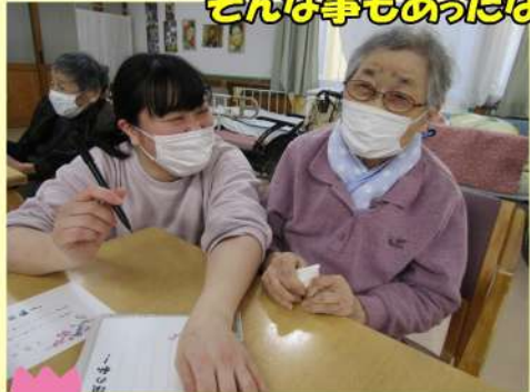
そんな事もあったなあ