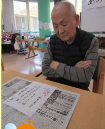
いつの頃のワシにしようかのあ