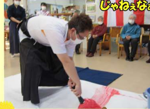
あいがたや あいがたや