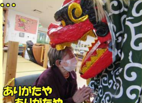
あいがたや あいがたや