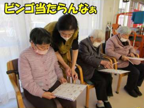
ビンゴ当たらんなあ