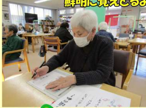
鮮明に覚えとるよ