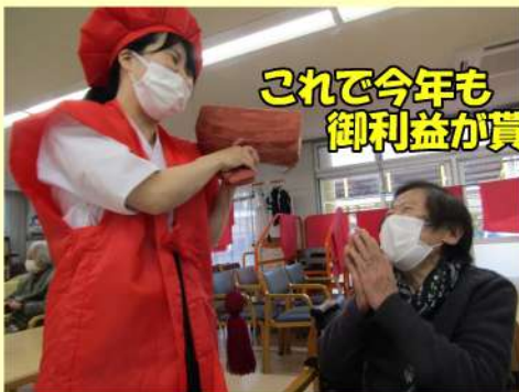
これで今年も 御利益が貰えたわ