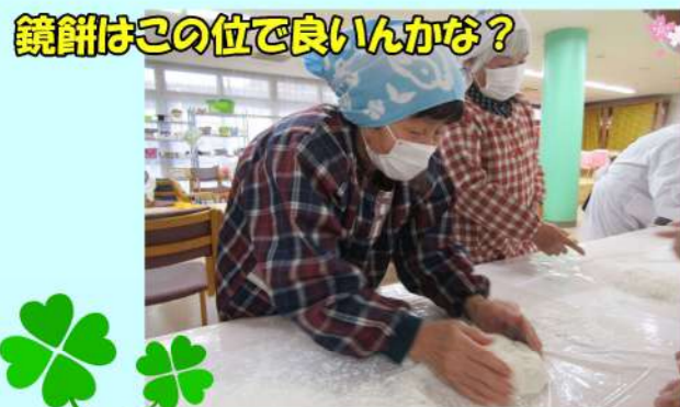
鏡餅はこの位で良いのかな?