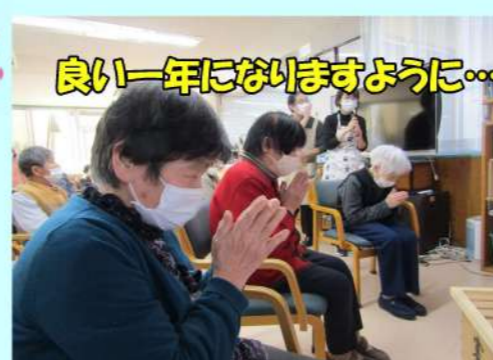
良い一年になりますように...