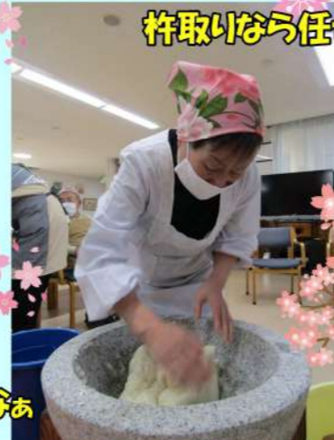
杵取りなう任せなさい