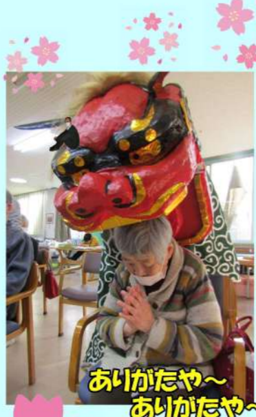
ありがたや~ ありがたや~