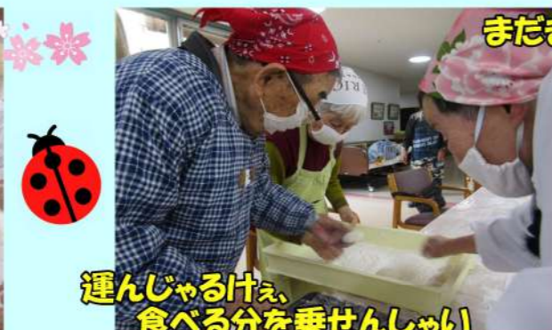
まだまだあるでえ