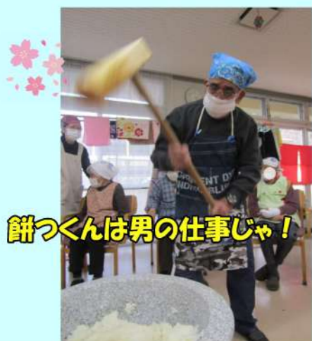
餅つくくんは男の仕事じゃ!

デイサービスでは、12月に「餅つき」を1月に「新年会」を行いました。餅つきでは、「コロナ」や「水害」等の厄払いの意を込めて力強くつき、皆で食す事で良い一年となる事を願いました。新年会では、「鶴亀神社」に参拝をし、絵馬に願い事を書きました。また、今年も獅子舞が登場し、皆様の頭を噛み、福を授けてくれました。