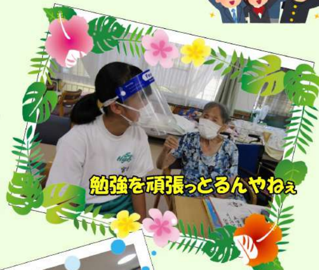
勉強を頑張るとるんやねえ

グリーンアンドリバーホームは地域貢献・交流委員会を中心に、地域の皆様との繋がりを目的とした活動を今後も行っていきます。