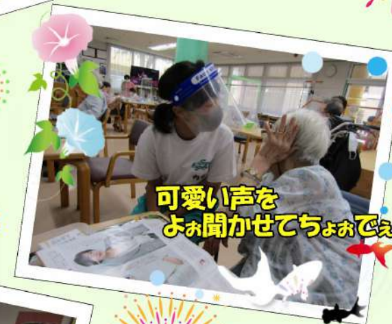
可愛い声をよお聞かせてちよおでえ