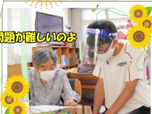
この問題が難しいのよ