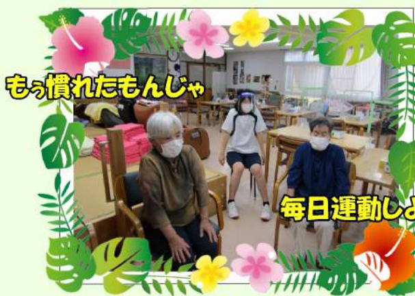
もう慣れたもんじゃ