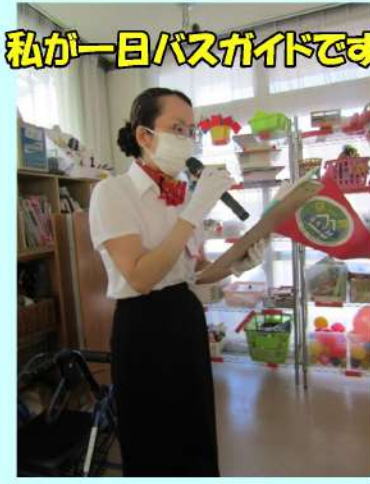
私が一日バスガイドです