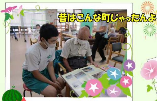
昔はこんな町じゃったんよ

地域交流の一環として、多くの学生ボランティアの方々に施設にお招きいたしました。ご利用者の皆様は、若い学生達に気分上々!! 職員に向けて下さる笑顔とは異なり、孫と接している様な優しい表情に。そんなご利用者と学生ボランティアの交流の一場面をご覧ください。