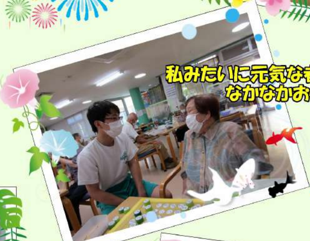
私みたいに元気な者はなかなかおらんで