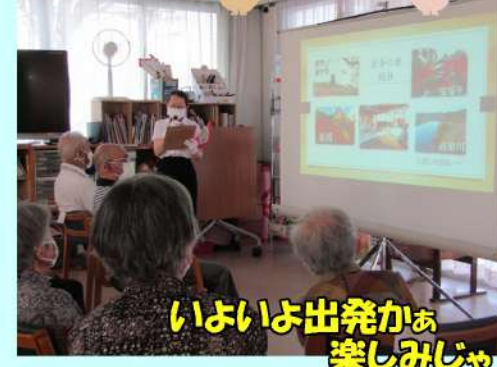
いよいよ出発かあ 楽しみじゃ