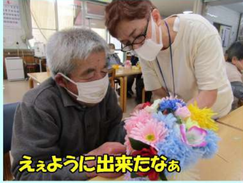
ええように出来たなあ