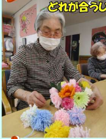
どれが合うじゃろうか

今号は前号載せる事のできなかつた行事も含め掲載します。 「フラワーアレンジメント」 「朝顔作り」 「岡山県一周旅行」 それぞれのご様子をご覧ください。